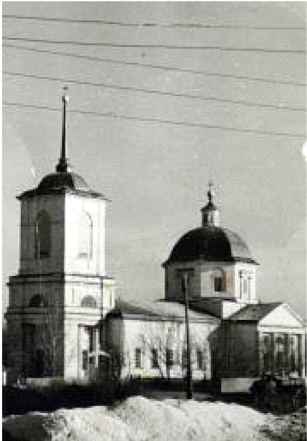
Вознесенский храм г. Аркадака